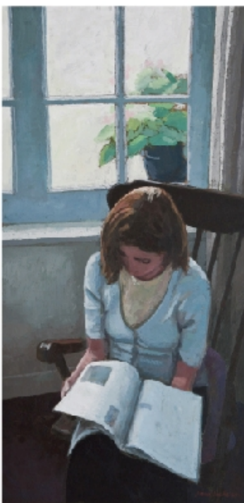
Le fauteuil à bascule - 100x50cm