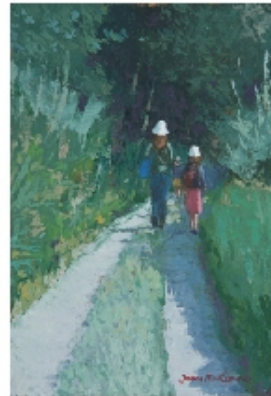
Vers la plage - 35x24cm