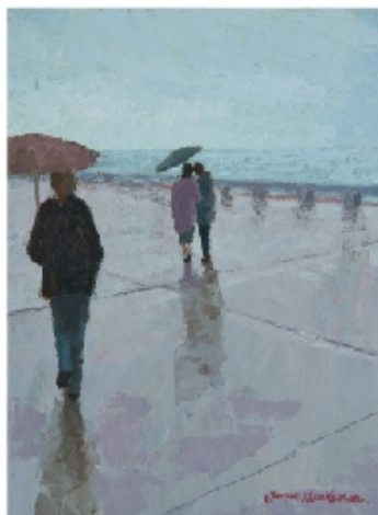
Un après-midi d'été - 35x27cm