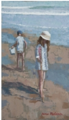
Les ombrées - 41x24cm