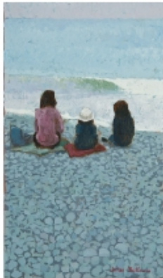
Les trois - 46x27cm