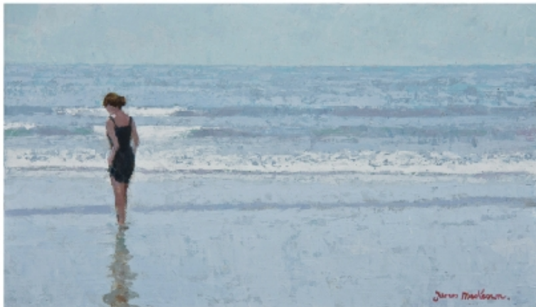
Le silence et la vague - 46x27cm

La Société de Lecture en Vieille Ville de Genève ne pouvait que l'accueillir.