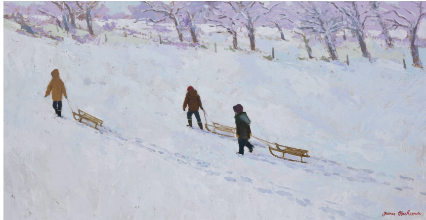
Les toboggans - 50x100cm