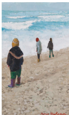
La mer agitée - 35x24cm

Page de couverture: Fin de la journée - 55x38cm