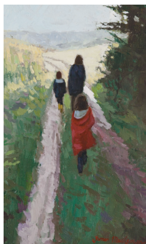
Manteau rouge - 41x27cm