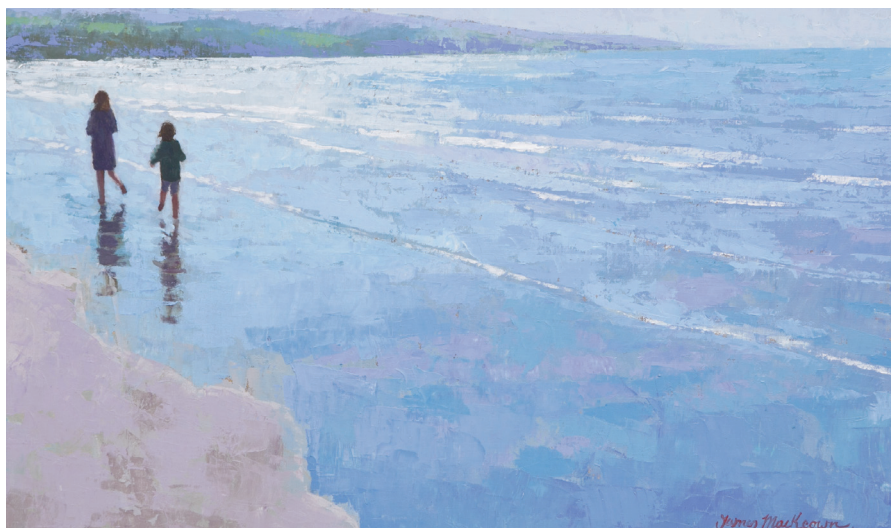
La lumière sur la plage - 55x38cm

Nous sommes particulièrement heureux de vous présenter pour la deuxième année consécutive à Genève, les œuvres les plus récentes de James MacKeown , peintre irlandais de naissance et normand d'adoption. La peinture de cet artiste n'est que le reflet de sa sensibilité, sans exubérance, mais au contraire inondée de pudeur, de délicatesse et d'intimité. La palette de ses couleurs nous transporte d'un coup sur les côtes normandes, où les ciels et les rivages nous rappellent inéluctablement sa terre natale.