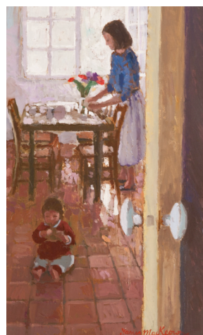
La cuisine - 46x27cm