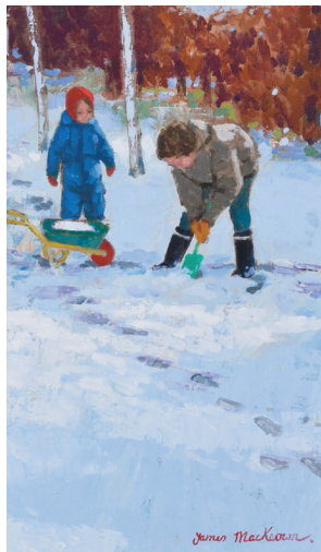
La brouette - 41x27cm