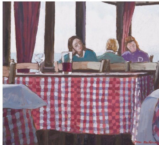
Le café de la plage - 65x50cm